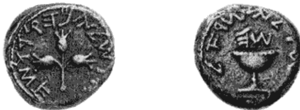
מִטְבַּע שְׁקֵל מִתְּקוּפַת בֵּר-כּוֹכְבָא (כּוֹ-60- שָׁנָה אַחֲרַת חוֹרְבַן הַבַּיִת) נַחֲלֹקוֹ רִשׁוּי הַגְּאוּנִים לְגַבִּי מִשְׁקֵלוֹ (וְכִפִּי שֶׁהוּבָא) בְּעַמִּי הַקְּדוּם

וְכֵן נִפְק"מ לְעֲנִין שִׁיעוֹרֵי אֹרֶךְ, שֶׁהֵרִי שִׁיעוֹר הָאֵמָה - 24 אַגוּדָלִים. וְלְמִידַת הָאֵגוּדֵל יֵשׁ יִחֹס קְבוּעַ לְשַׁעַר הַרַבִּיעִית (כַּמְבּוֹאֵר בְּפַסְחִים קֵט, וְכִפִּי שֶׁהוּבָא בְּתַחֲלִילַת דְּבָרֵינוּ). וְהֵנָּה, מָה שֶׁמְקוּבַל לְפִי הַגֵּר"ח"נ שֶׁשִּׁיעוֹר הָאֵמָה 48 ס"מ - מְקוּרוֹ מִשׁוּם שֶׁהַעֲלָה שֶׁהַרַבִּיעִית 86 סמ"ק. אֲבָל לְפִי שִׁיעוֹר רַבִּיעִית שֶׁל 75 סמ"ק - עוֹלָה שֶׁהָאֵמָה 46 ס"מ (שֶׁהִיא גַם תּוֹאֲמַת אֶת הָאֵמָה הַמְּצִיאֹתִית כִּפִּי שֶׁכֶּבֶר הוּבָא לְעֵיל), וְאִז - יִשְׁתַּנּוּ גַם מִידוֹת הַ"טַפְּחָ" וְהַ"אַצְבַּע" בְּהַתָּאֵם, וְיֵהִיָּה שִׁיעוֹר הַטַּפְּחָ - 7.6 ס"מ, וְשִׁיעוֹר הָאַצְבַּע - 1.9 ס"מ.