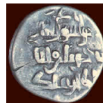
תמונת מטבע דרהם עתיק